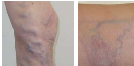
linkes Foto: Stammvarikose im Verlauf der Hauptstammvene

dium erreicht. Dabei tritt in der Regel ein Ekzem auf, begleitet von Juckreiz, einer Braunfärbung der Haut im Bereich der Knöchel oder einer Einsteifung des Sprunggelenks. Unbehandelt kommt es zu offenen Beinen mit Beingeschwüren. Hier von ist ca. 1% der schweizer Bevölkerung betroffen.