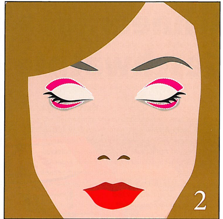
Illustration: Jana Richert